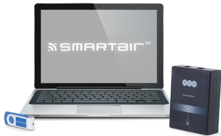
PC mit Software und Karten-Codierer