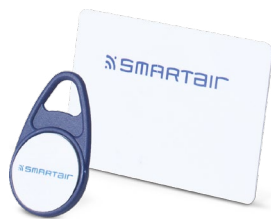
Karte und Schlüssel-Tag