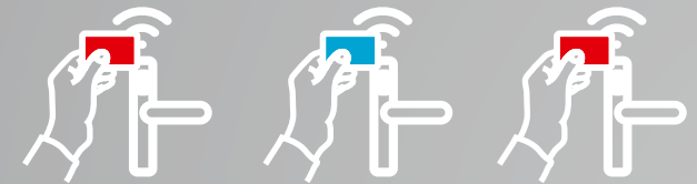
Aktivieren des Programmiermodus